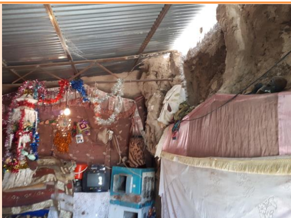
عکس داخلی - دیوار جنوبی - دیوار قدیمی باغ