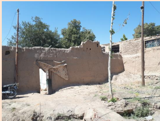
نمای سردر از معبر اصلی

توضیحات عکس: دسترسی از معبر خاکی با کمی عقب نشینی قرار دارد. حیاط فضای مشترک ای است با کارگاه نجاری و در شرق حیاط (سمت چپ تصویر حیاط) باغچه محصور شده ای قرار دارد که پدر خانواده در آن گیاه آلورا کشت میکند