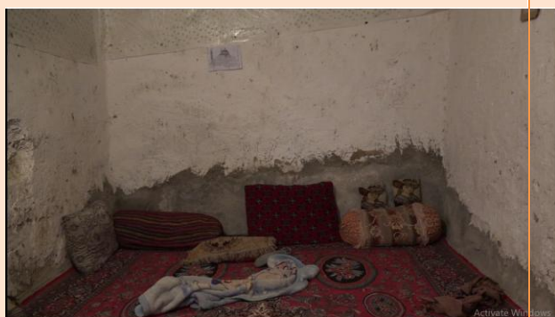
نمای اتاق ۲