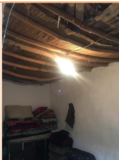
نمای اتاق ۱