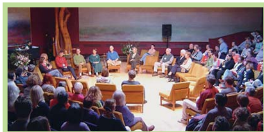
عکس ۵- جلسه عمومی هم‌فکری و تصمیم‌گیری مشارکتی در اکودهکده فیندهورن، اسکاتلند

اکودهکده‌ها اجتماع‌هایی هستند که در آنها فرد احساس حمایت از طرف دیگران و مسؤولیت نسبت به اطرافیان خود دارد. آنها حسی عمیق از تعلق گروهی را ایجاد می‌کنند و به آن اندازه کوچک هستند که فرد بتواند احساس امنیت، حمایت، دیدن و شنیدن داشته باشد. به این ترتیب افراد به صورتی شفاف