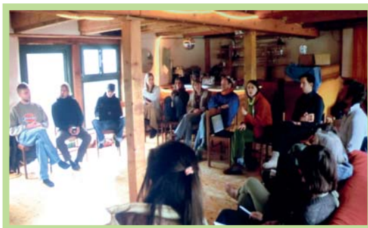
عکس ۸- جمع فرهنگی - معنوی با محوریت مسائل انسانی در یک اکودهکده