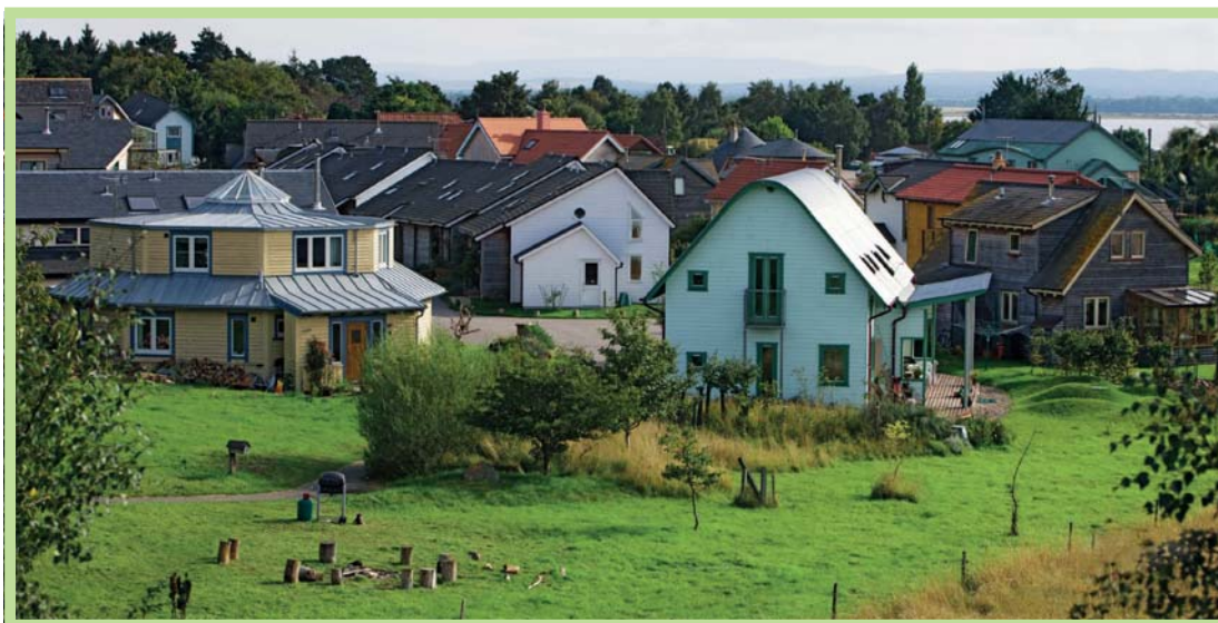
عکس ۲- منظره واحد همسایگی در اکودهکده فیندهورن، اسکانلند

اکودهکده معمولاً به اجتماع‌هایی که با قصد و نیت قبلی ایجاد شده‌اند، اطلاق می‌شود، که ساکنان آنها خواهان زندگی به شیوه‌ای پایدارتر و تجربه بیشتر احساس زندگی اجتماعی، به جای الگوی رایج زندگی فردی هستند که ناخواسته بر ما تحمیل شده است. اما، در دهه گذشته گرایشی نیز در دهکده‌های سنتی و بومی تقویت شده است که تخریب زیست محیطی را متوقف، اقتصادهای محلی پایدار را تقویت، و از هویت و فرهنگ سنتی خود که در حال نابودی است، حفاظت کنند. بنابراین جنبش اکودهکده‌ها هر دو نوع ایجاد اجتماع محلی با قصد و نیت قبلی و نیز تحول و تبدیل روستاها و جوامع محلی موجود که دارای توان‌های زندگی اجتماعی‌اند، در صورت قصد و نیت بعدی ساکنان به انتخاب الگوی زیست پایدار را، شامل می‌شود.