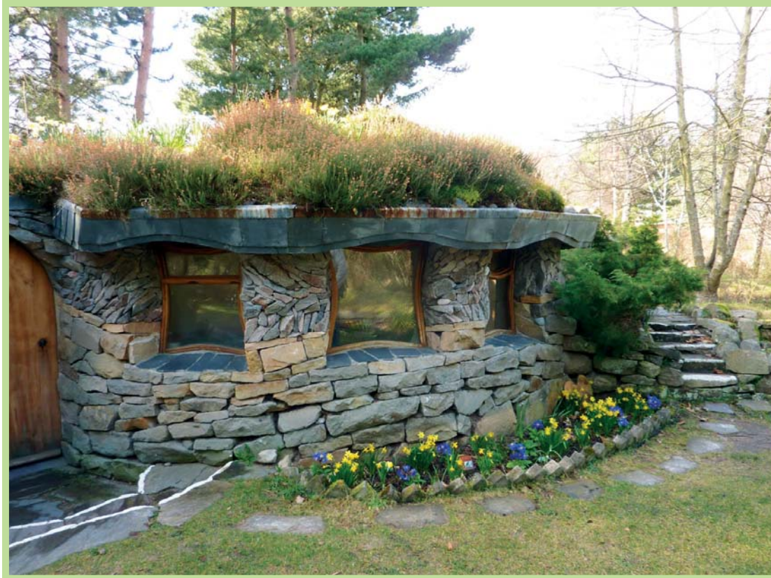
عکس ۷- معماری متأثر از طبیعت در اکودهکده فیندهورن، اسکاتلند