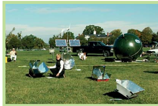
عکس ۹- آزمایش میدانی برای دهکده خورشیدی در اکودهکده تامرا، پرتغال