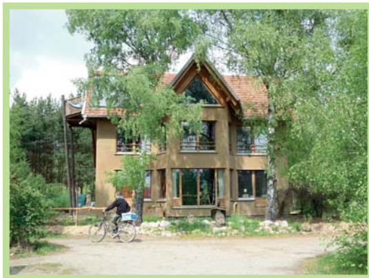
عکس ۴- نمای معماری بومی از کاهگل و چوب در اکودهکده

مهم‌ترین خصوصیات اکودهکده‌ها برابر نظر "جاناتان