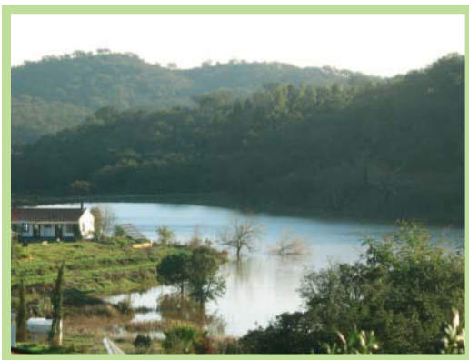
عکس ۱- منظره عمومی اکودهکده تامرا با دریاچه مصنوعی، پرتغال

این ابعاد نیز حیاتی است. در این رویکرد به توان جوامع انسانی برای گردهم آمدن و طراحی مشترک مسیر به سوی آینده به عنوان یک نیروی محرک اصلی برای تغییرات مثبت نگریسته می شود.