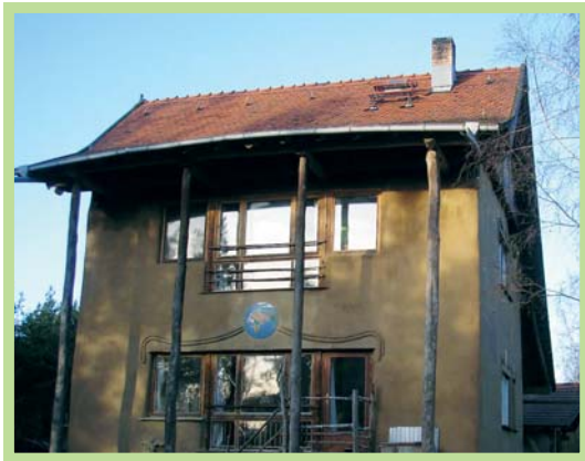
عکس ۶- نمونه معماری بومی از کاه گل و چوب در زمین لیندن، آلمان

قادر به مشارکت در اتخاذ تصمیم‌هایی می‌شوند که مستقیماً بر زندگی آنها و سرنوشت اجتماع تأثیر دارد.